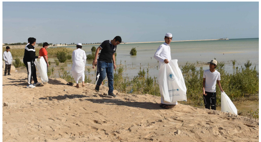
حملة لتنظيف شواطئ قطر

تحتفل دولة قطر في 26 فبراير من كل عام بيوم البيئة القطري.