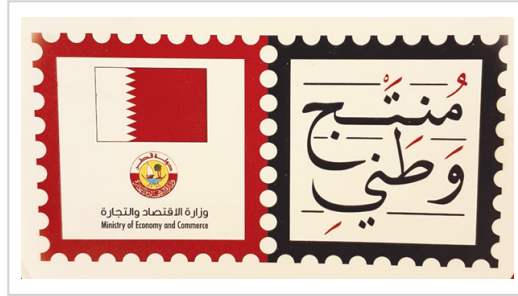
"منتج وطني" - حملة لدعم الإنتاج المحلي القطري