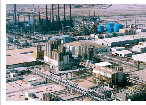
منطقة مسييعيد الصناعية

تُعدُّ المدينة الصناعية الأولى والأقدم في دولة قطر وتتركز