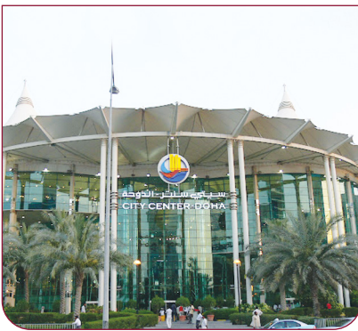
سِيتي سنْتر الدَّوْحَة

الأَسْواقُ وَالمَراكِزُ التّجاريَّةُ فِي قَطَرٍ