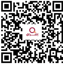
الانشطة الاقتصادية في قطر

أَنْعَمَ اللَّهُ عَلَى بِلَادِنَا الْحَبِيبَةِ قَطَرَ بِثَرَوَاتٍ طَبِيعِيَّةٍ، أَهَمُّهَا: النَّفْطُ وَالْغَازُ الطَّبِيعِيُّ وَفِي السَّنَوَاتِ الْأَخِيرَةِ شَهِدَتْ بِلَادُنَا تَطَوُّرًا كَبِيرًا فِي كُلِّ الْمَجَالَاتِ.