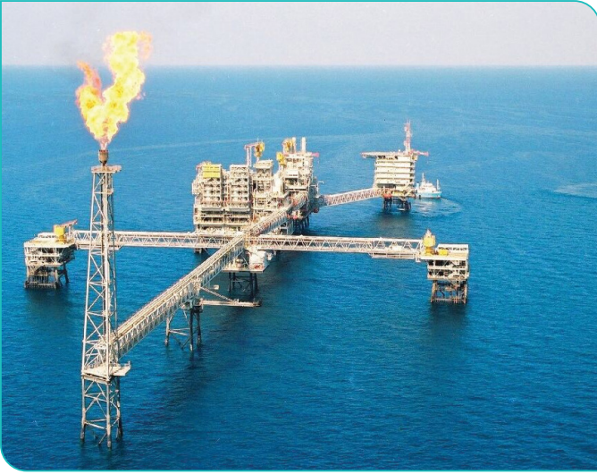
حَقْلُ غَازِ الشَّمَالِ