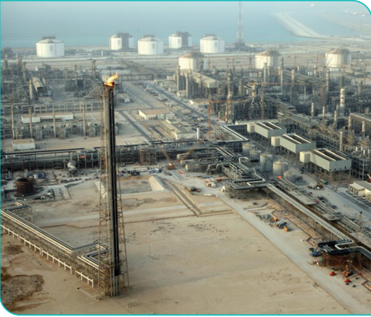
مَدِينَةُ رَأْسِ لِفَانِ الصَّنَاعِيَّةُ

◀ مَا أَهَمِّيَّةُ الْبَثْرُولِ وَالْغَازِ الطَّبِيعِيِّ فِي حَيَاتِنَا؟