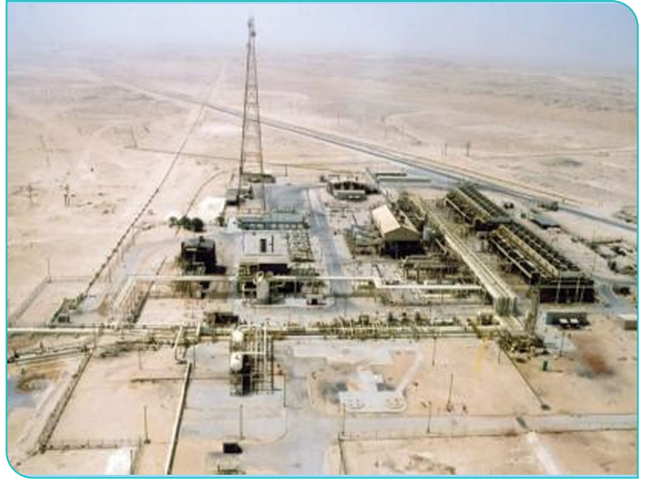
حَقْلُ النِّفْطِ فِي دَخَانَ