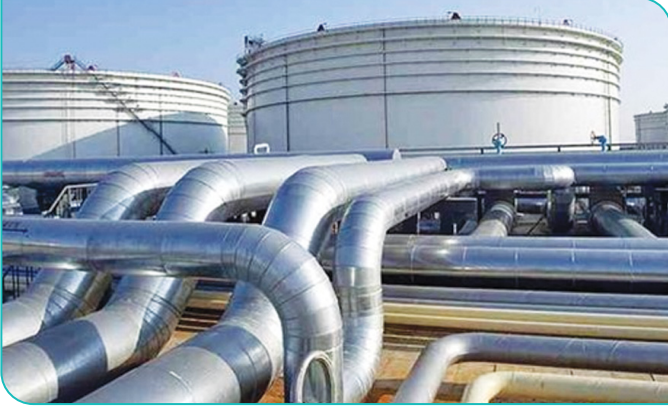
صناعة الغاز المُسال