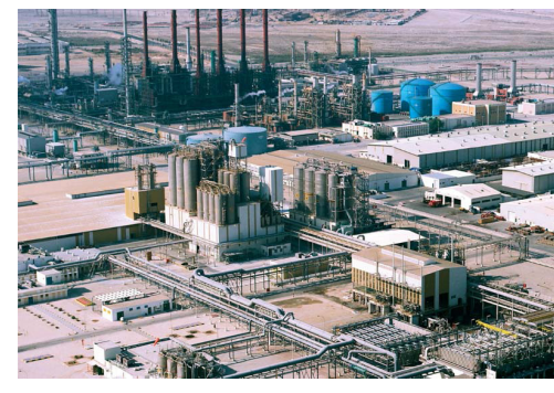
منطقة مسييعيد الصناعية

تُعدُّ المدينة الصناعية الأولى والأقدم في دولة قطر وتتركز