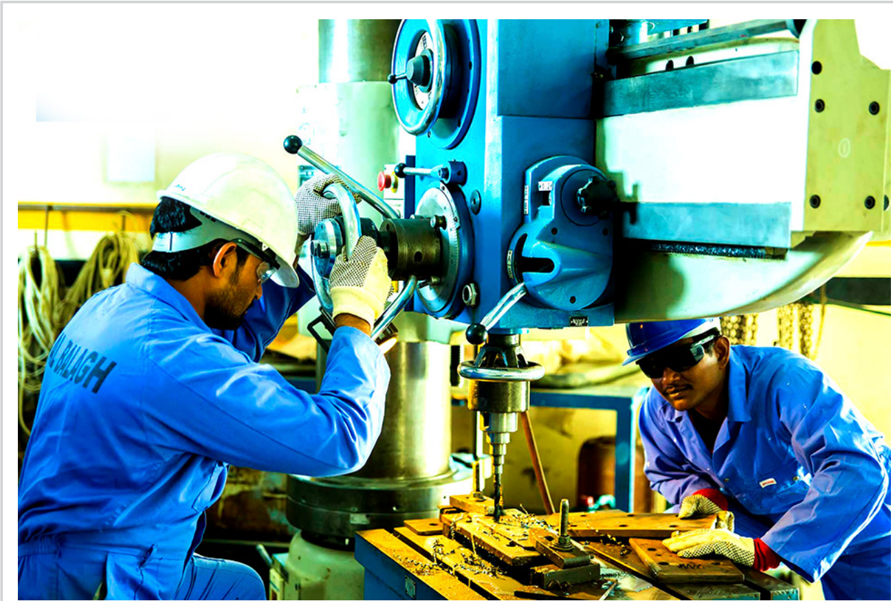
الصناعة التحويلية في دولة قطر

4 - استثمار الأموال الوطنية بشكل آمن وبعيد عن المخاطر الخارجية مثل الأزمات الاقتصادية التي تحدث في العالم.