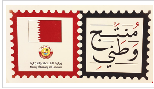
"منتج وطني" - حملة لدعم الإنتاج المحلي القطري