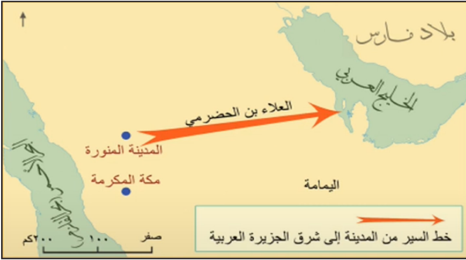
خريطة انتشار الإسلام في منطقة الخليج

بعد أن أتم الرسول صلى الله عليه وسلم تأسيس الدولة ومركزها المدينة المنورة، وعقد هدنة مع قريش عرفت باسم صلح الحديبية في العام السادس من الهجرة، سعى لنشر الدعوة الإسلامية في أطراف الجزيرة العربية، فقام صلى الله عليه وسلم بإرسال الرُّسل إلى زعماء القبائل في أطراف الجزيرة العربية.